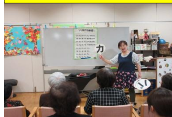
口腔体操(パタカラ体操)