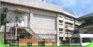
開所当初のせりがや会館