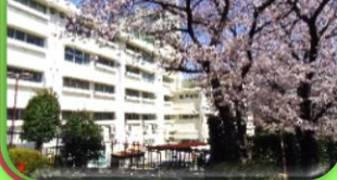
現在のせりがや会館