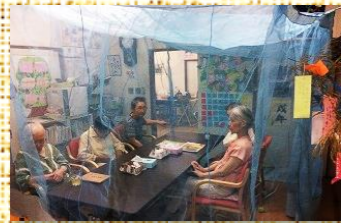
蚊帳の中で・・・