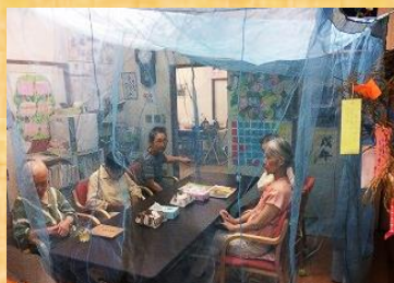
蚊帳の中で・・・