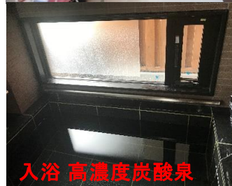
入浴 高濃度炭酸泉