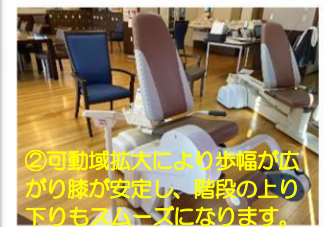
②可動域拡大により膝幅が広がり膝が安定し、階段の上り下りもスムーズになります。