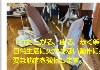
①立ち上がる、座る、歩く等、日常生活に欠かせない動作に必要な筋肉を強化します。