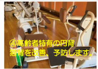
④高齢者特有の円背猫背を改善、予防します。