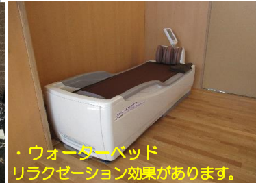
・ウォーターベッド リラクゼーション効果があります。

カノン 介護予防デイサービス 午前の部 9:00~10:30 午後の部 15:15~16:45 1時間30分 定員10名 営業日:月曜~金曜