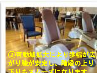
②可動域拡大により歩幅が広がり膝が安定し、階段の上り下りもスムーズになります。