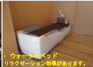
ウォーターベッド リラクゼーション効果があります。