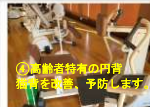
④高齢者特有の円背猫背を改善、予防します。