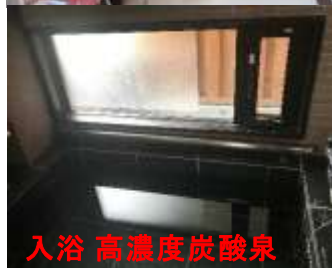
入浴 高濃度炭酸泉