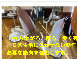
①立ち上がる、座る、歩く等、日常生活に欠かせない動作に必要な筋肉を強化します。